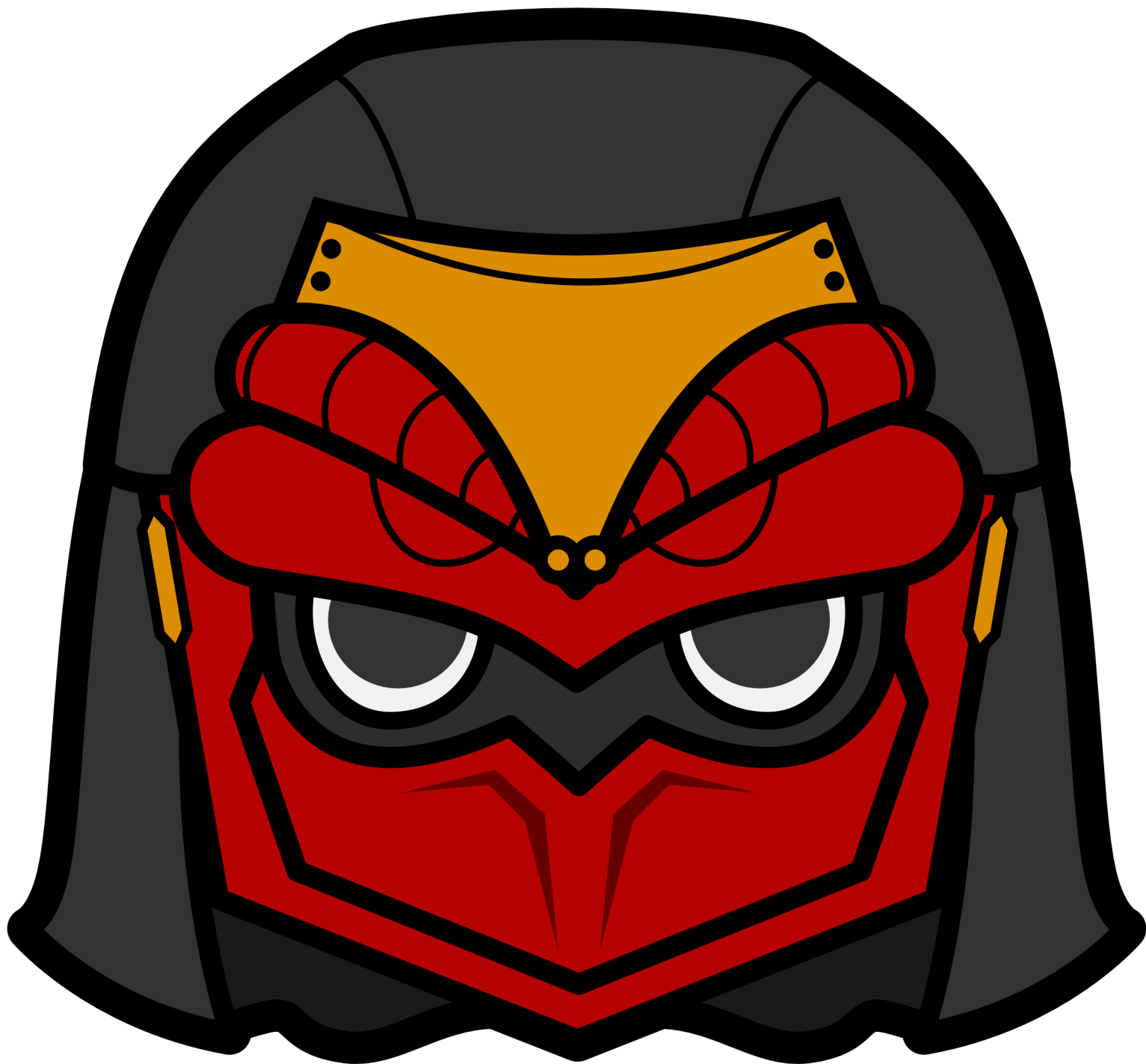
Illustration by mana [ https://8bitfile.jimdofree.com/ ]